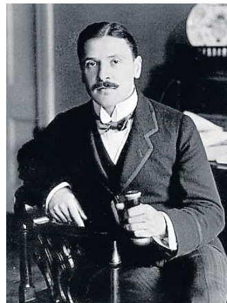
Somerset W. Maugham estuvo en el Pilar.