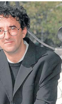
ño escribió de Zaragoza.