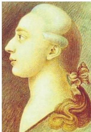
Giacomo Casanova. FRANCESCO CASANOVA