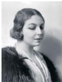
María Teresa León.